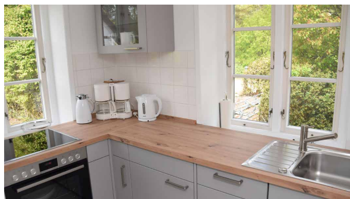
Blick in die offene Küche