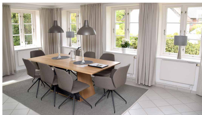
Großzügiger, heller Essbereich