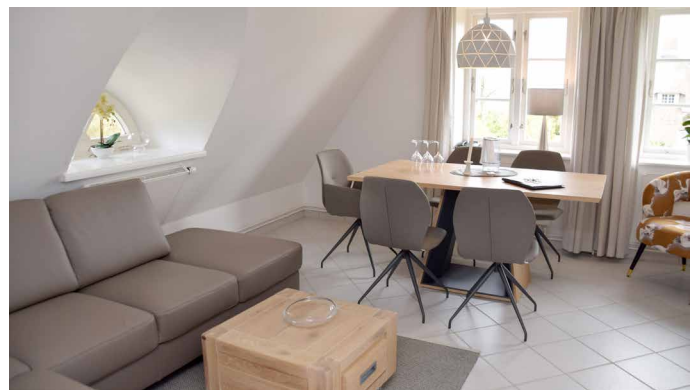
Wohn- und Essbereich in Wohnung 2