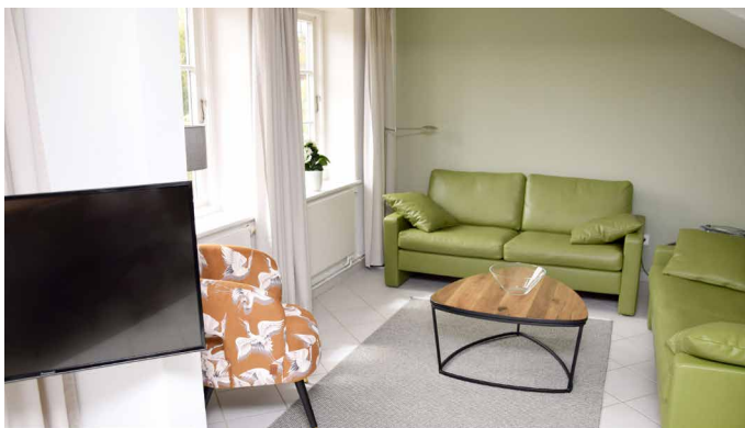
Wohnbereich mit Sitzecke in Wohnung 1

• 1 Doppelschlafzimmer, 1 Doppelschlafzimmer im Dachgeschoss mit ausklappbarem Schlafsofa für eine 5. Person