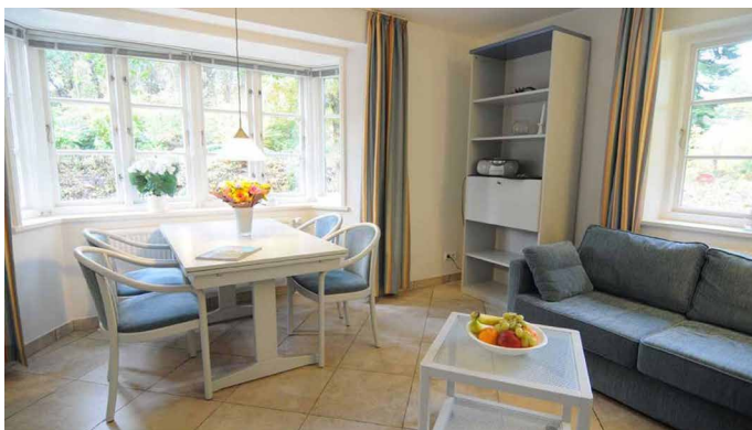
Ess- und Wohnbereich