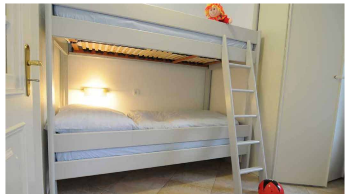
Kinderzimmer mit Etagenbetten