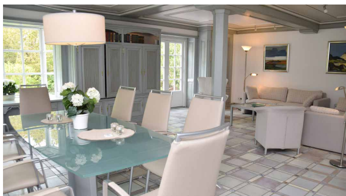
Essbereich mit Blick in den Wohnbereich