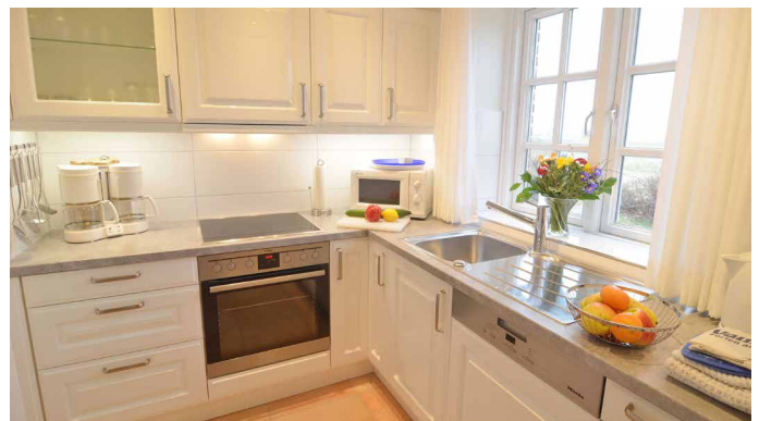
Blick in die Küche