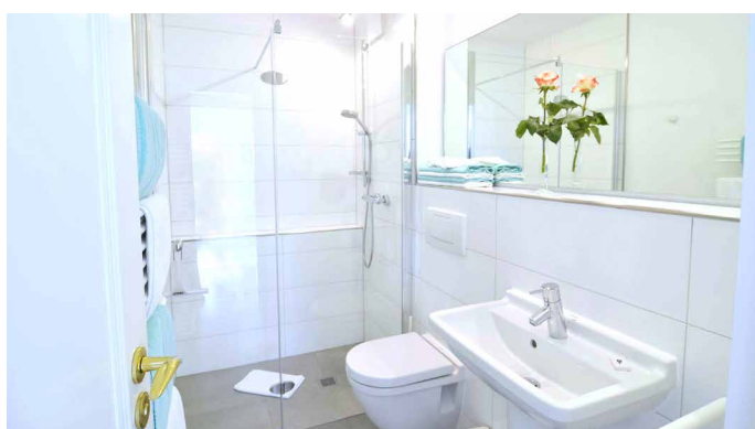
Badezimmer mit bodenbündiger Dusche