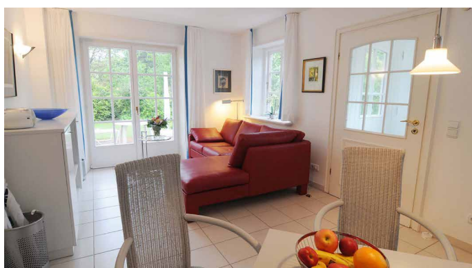
Wohnzimmer und Terrasse