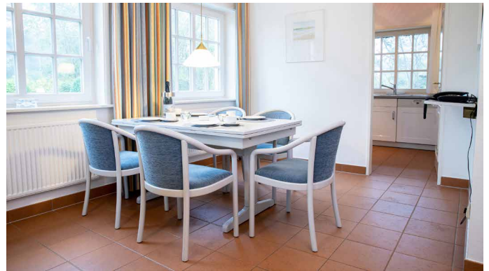
Essbereich und Blick in die Küche