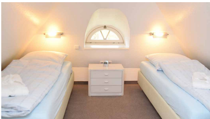
Weiteres Schlafzimmer mit Einzelbetten