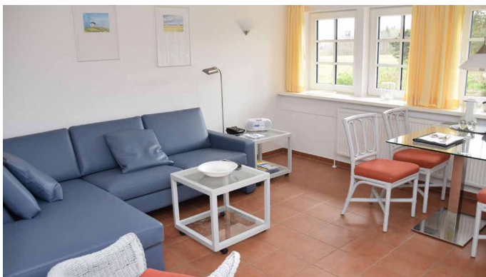
Wohn- und Essbereich