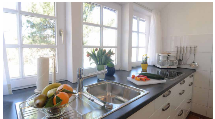
Blick in die offene Küche