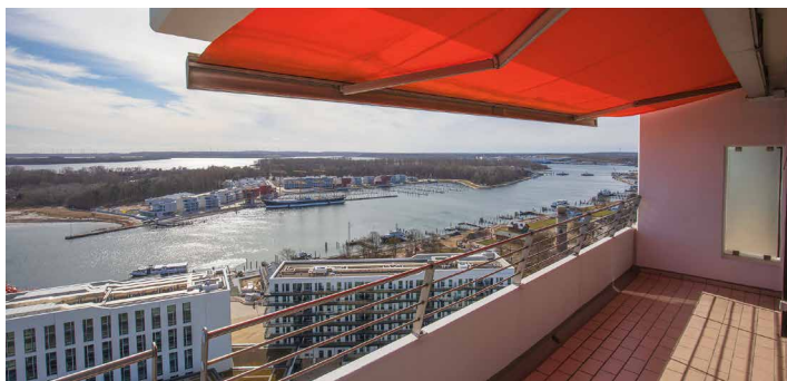
Balkon mit Blick auf Travemünde und das offene Meer

Ausstattung und Einrichtung sprechen für sich. Das Einzige was Sie mitbringen müssen, ist sich selbst. Ansonsten ist auch diese Wohnung umfangreich ausgestattet und hat – vom Bademantel bis zur Spülmaschine – alles, was Sie für einen erholsamen Urlaub brauchen.