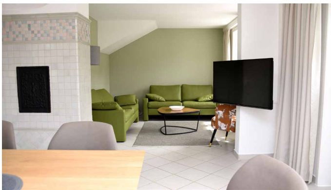
Esszimmer mit Blick in den Wohnbereich