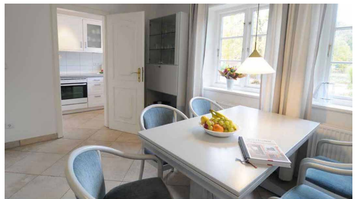
Essbereich mit Blick in die Küche