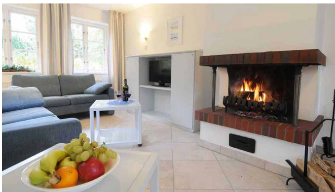
Wohnzimmer mit Kaminofen