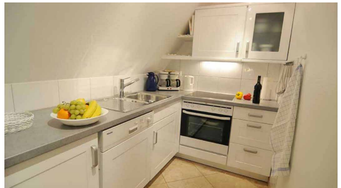
Blick in die offene Küche