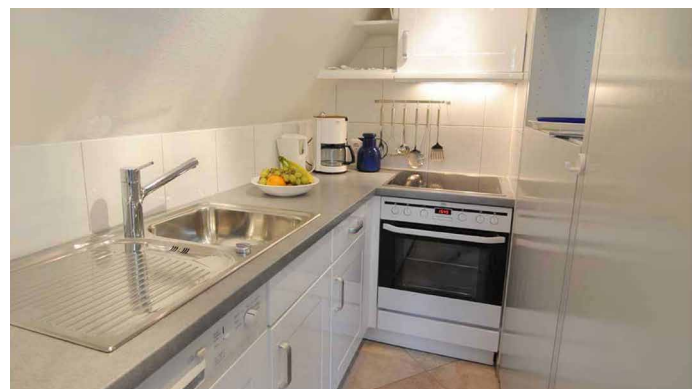
Blick in die Küche