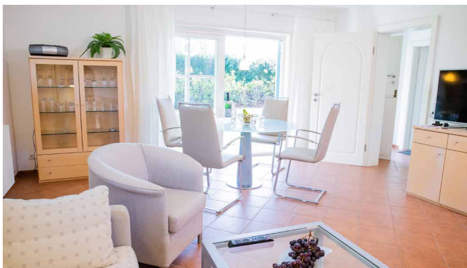
Essbereich und Blick auf die Terrasse