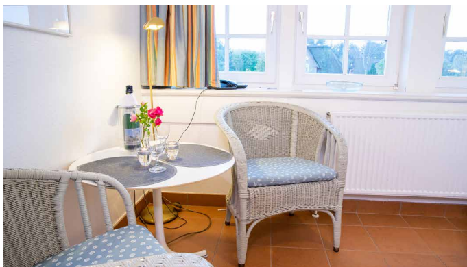
Sitzecke im Doppelschlafzimmer