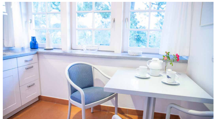
Essbereich in der Küche