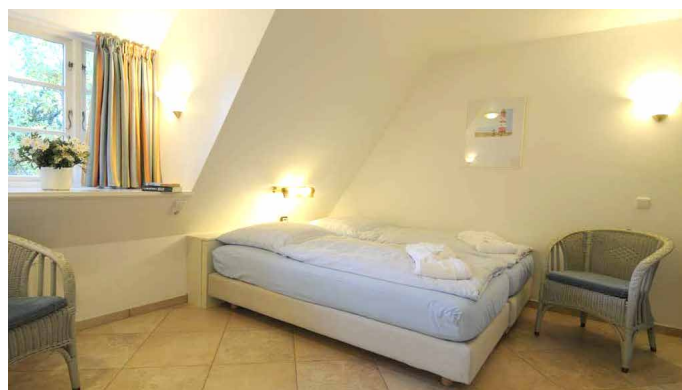
Schlafbereich mit Doppelbett