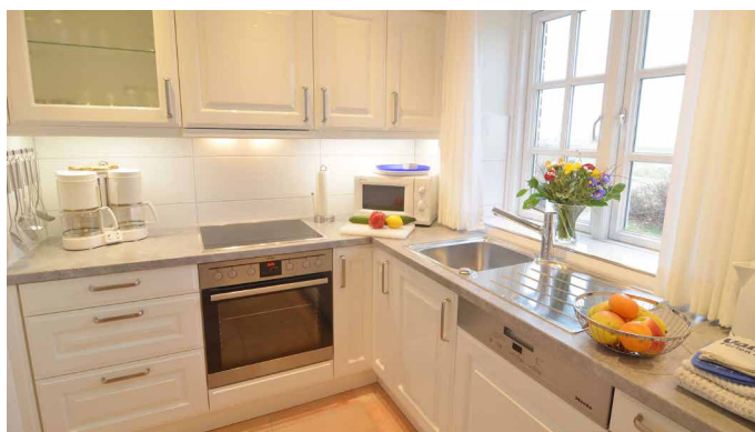
Blick in die Küche