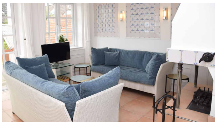
Blick in den Wohnbereich mit Kaminofen