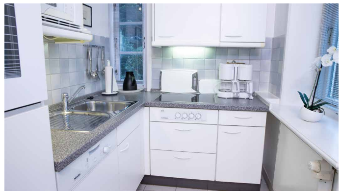
Blick in die offene Küche