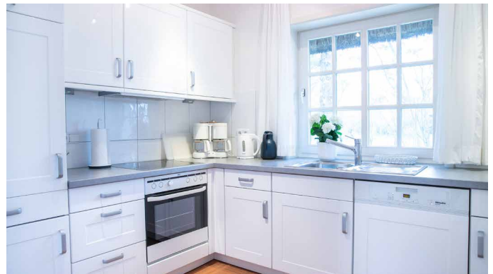
Blick in die offene Küche