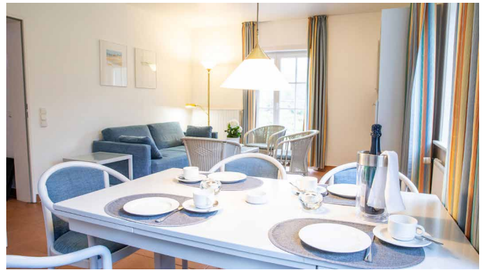
Essbereich mit Blick ins Wohnzimmer