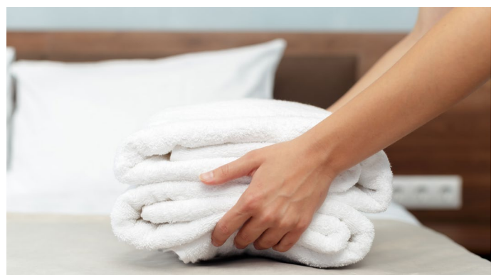
Unser Service für Ihre Erholung