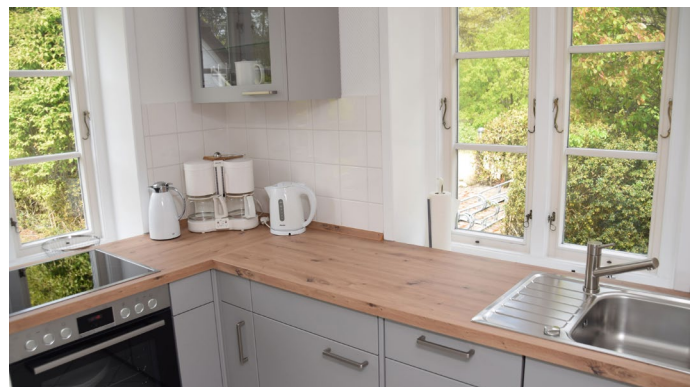
Blick in die offene Küche