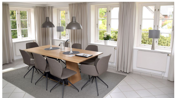
Großzügiger, heller Essbereich