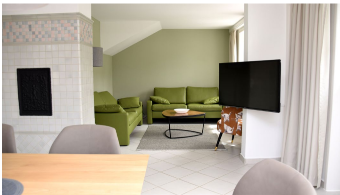
Esszimmer mit Blick in den Wohnbereich