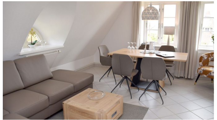
Wohn- und Essbereich in Wohnung 2