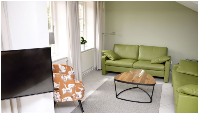
Wohnbereich mit Sitzecke in Wohnung 1