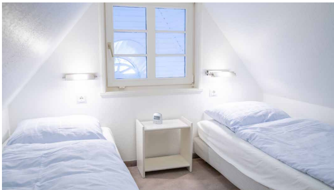
Abgeschlossenes Jugendzimmer mit 2 Einzelbetten