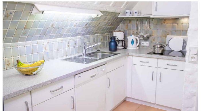
Blick in die offene Küche