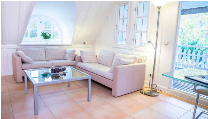
Wohnbereich mit Blick auf die Loggia