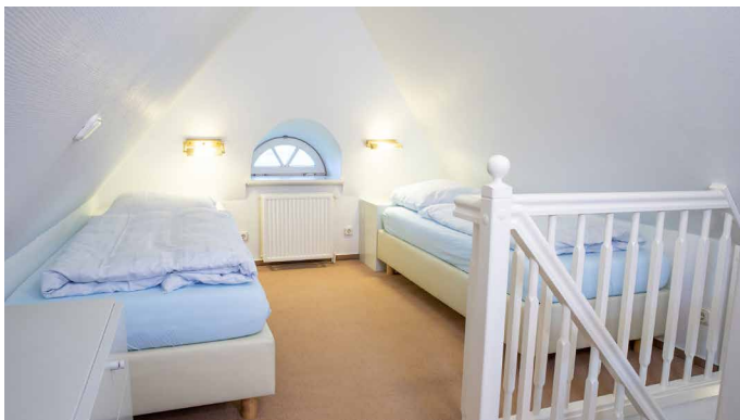
Schlafzimmer mit Einzelbetten