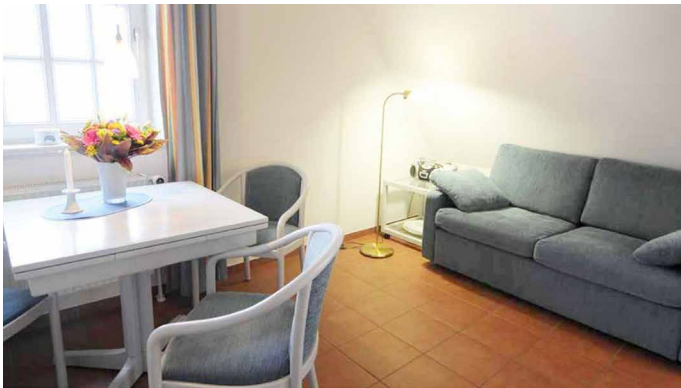
Ess- und Wohnbereich