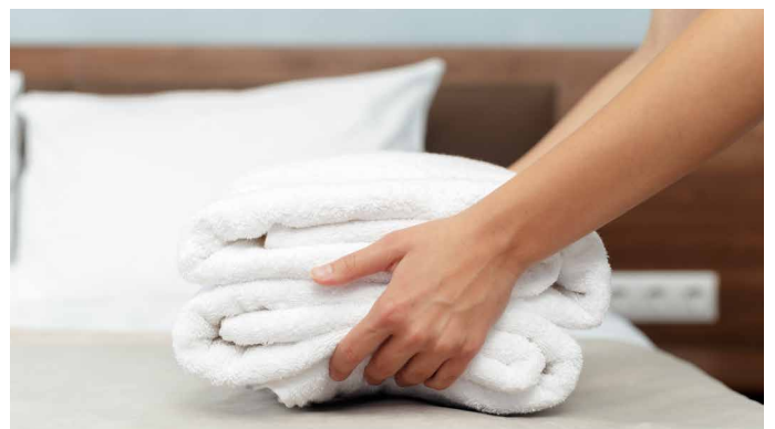
Unser Service für Ihre Erholung

> Jetzt buchen unter www.vamera.de oder 0451-200 12 96