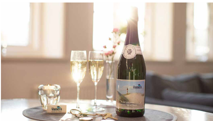
Ankommen und wohlfühlen