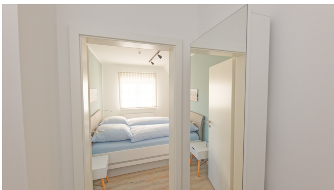
Blick vom Flur